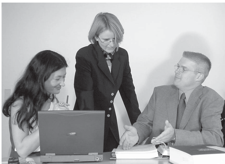
EU-Fundraiser nutzen Datenbanken, besuchen aber auch Informationstage zu Förderprogrammen oder europäischen Konferenzen zum jeweiligen Arbeitsgebiet.

Speziell im Bereich EU-Fördermittel-Akquisition bietet „emcra – Europa aktiv nutzen“ die einzige zertifizierte Weiterbildung im EU-Fundraising auf dem deutschen Markt an. Die Zertifizierung